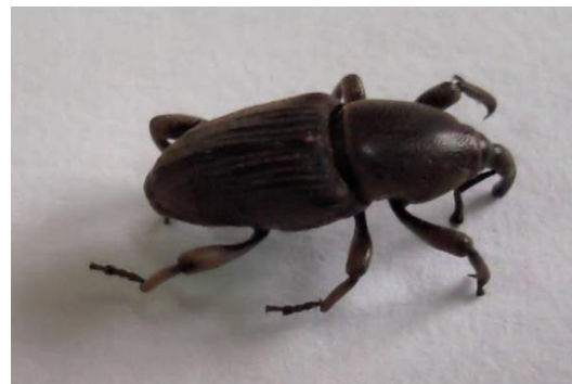
Figura 1 - Adulto de gorgulho da bananeira.