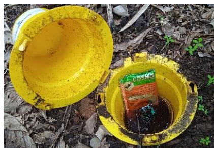
Figura 3 - Armadilha Cosmotrack com a feromona de agregação Cosmoplus

O gorgulho da bananeira (Fig. 1) é uma praga-chave da bananeira nos Açores.