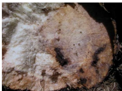
Figura 2- Galerias causadas pelas larvas de gorgulho no interior do pseudo-caule da bananeira.