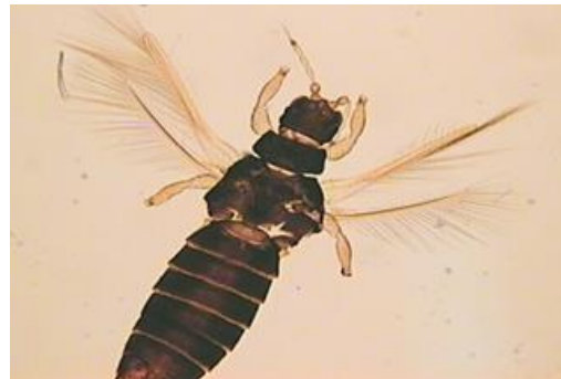
Figura 1 – Adulto de tripe da bananeira ( Heliothrips haemorrhoidalis Bouché).