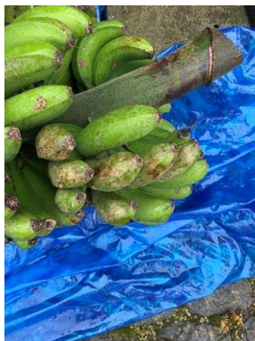
Figura 2 – Aspeto estrago na banana de tripes.