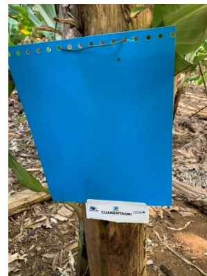
Figura 3 – Armadilhas cromotrópicas amarelas e azuis.

As tripes são pequenos insetos com uma coloração que vai de amarela, passando por castanho-escuro até atingir a cor preta (Fig.1). A presença de dois pares asas franjadas nos seus adultos é característica (Fig.1).